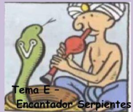
Tema E - Encantador Serpientes