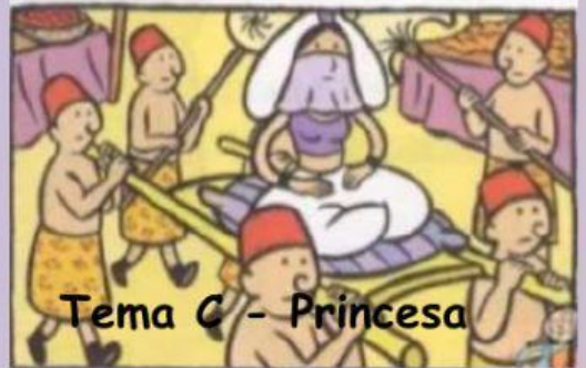
Tema C - Princesa