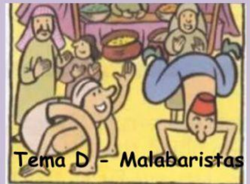
Tema D - Malabaristas