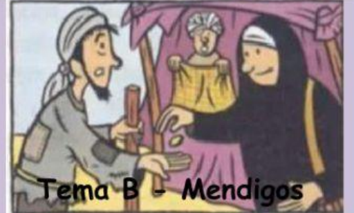
Tema B - Mendigos