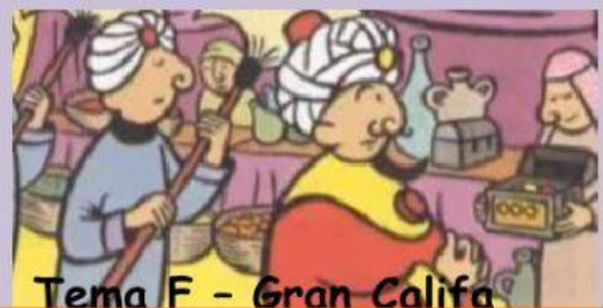
Tema F - Gran Califa