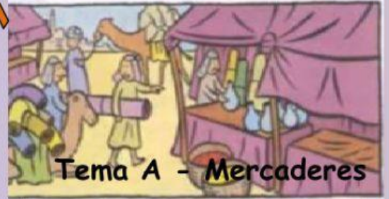
Tema A - Mercaderes