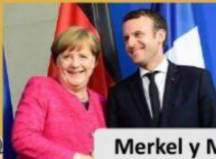
Merkel y Macron