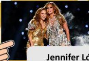
Jennifer López y Shakira