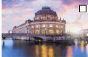
7 die Museumsinsel