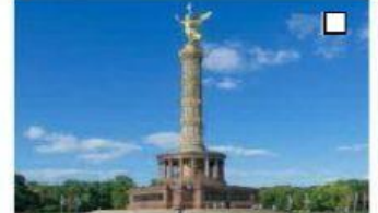
8 die Siegessäule