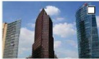
5 der Potsdamer Platz