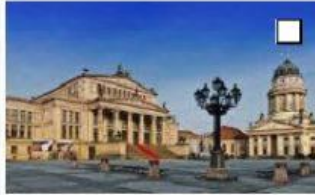
6 der Gendarmenmarkt