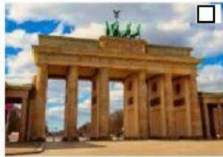
2 das Brandenburger Tor