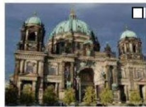
3 der Berliner Dom