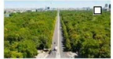
12 der Tiergarten