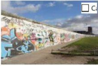
1 die East Side Gallery