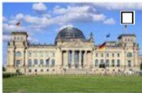
9 der Reichstag