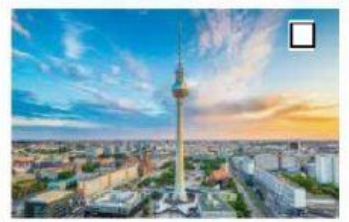
4 der Fernsehturm