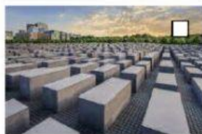
10 das Holocaust Denkmal