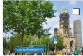
11 der Kurfürstendamm