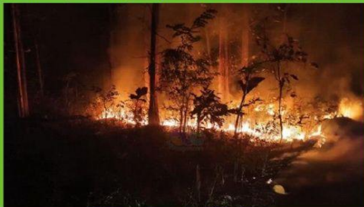
Kebakaran hutan jati milik Perhutani, terjadi di Petak 24A RPH Dander, BKPH Dander, KPH Bojonegoro. Senin (13/07/2020).