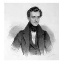
J. STRAUSS I