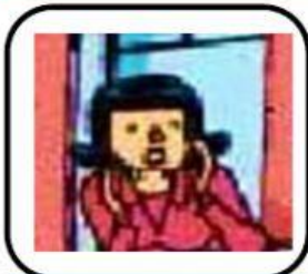
La mère de Théo