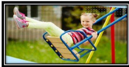
Gambar 1. Seorang anak bermain ayunan