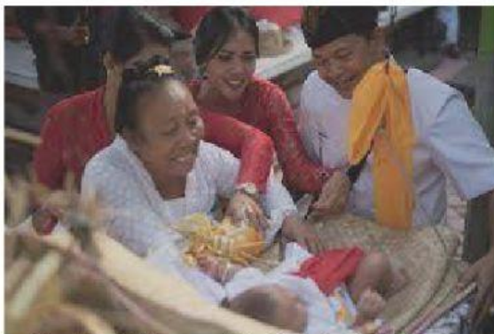
Gambar 2. Upacara Nelu Bulanin Bayi Meayun