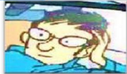
Le père d'Emma