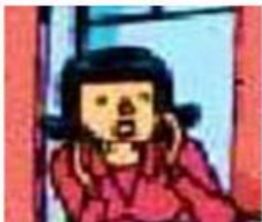
La mère de Théo