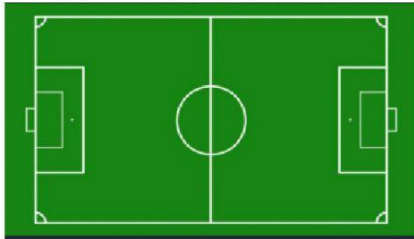
LAPANGAN SEPAK BOLA

Pengelola suatu lapangan sepak bola di Kec. Kalianda akan memperbarui rumput lapangan disebabkan rumput yang sekarang memiliki kualitas yang belum sesuai standar. Sebelum membeli rumput baru, pihak pengelola akan mengukur luas lapangan sepak bola tersebut. Lapangan tersebut memiliki panjang dalam bentuk aljabar (2x - 2) dan lebar (3x + 5) .