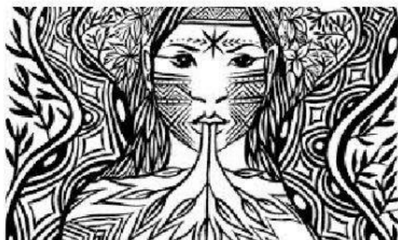
ARTE INDÍGENA - FIGURA 1