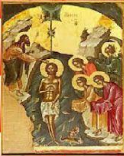
Вход Господен в Йерусалим

1. Свържи иконите с имената на празниците.