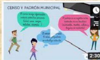
CENSO Y PADRÓN.