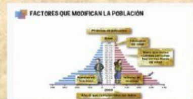
FACTORES QUE MODIFICAN LA POBLACIÓN.