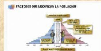
FACTORES QUE MODIFICAN LA POBLACIÓN.