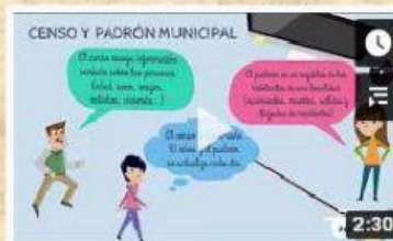
CENSO Y PADRÓN.