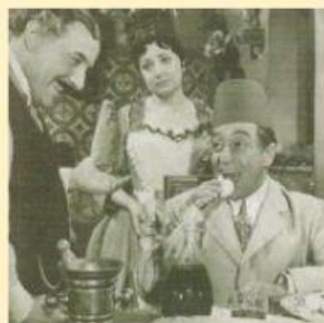
Il grande Totó in Un turco napoletano.

Vittorio Gassman (a sinistra) e Alberto Sordi (a destra) nel film La grande Guerra di Mario Monicelli.