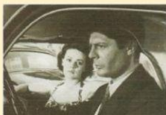
Marcello Mastroianni in "La notte" di Michelangelo Antonioni.

Altri attori molto famosi a livello internazionale: Anna Magnani (premio Oscar nel 1955), Claudia Cardinale, Gina Lollobrigida, Nino Manfredi, Ornella Muti, Ugo Tognazzi, Giancarlo Giannini e tanti altri.