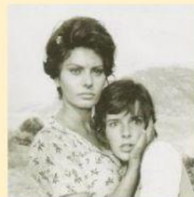
Sofia Loren in La Ciociara.