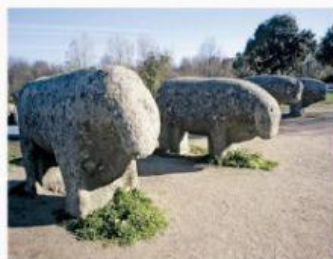
Los toros de Guisando (Ávila).

Las casas eran muy sencillas, hechas con muros de adobe o piedra y techos de ramas y paja.