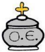
UNCIÓN DE ENFERMOS