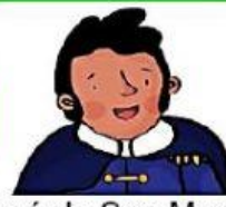
José de San Martín