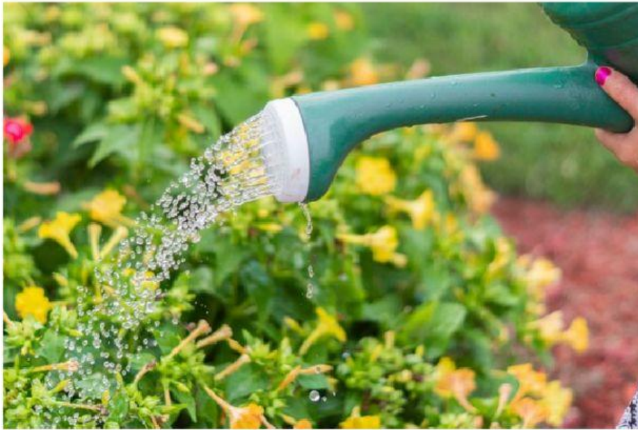
Gambar 8. Menyiram tanaman

Air yang terdiri atas elemen hidrogen (H) dan oksigen (O) sangat penting untuk semua komponen lingkungan, baik biotik maupun abiotik. Semua organisme tanpa terkecuali membutuhkan air sebagai penyokong kehidupannya. Tubuh manusia sebagian besar juga tersusun dari air. Selain itu, air juga dimanfaatkan oleh tumbuhan untuk mendukung proses fotosintesis. Air juga menjadi habitat dari berbagai jenis makhluk hidup.