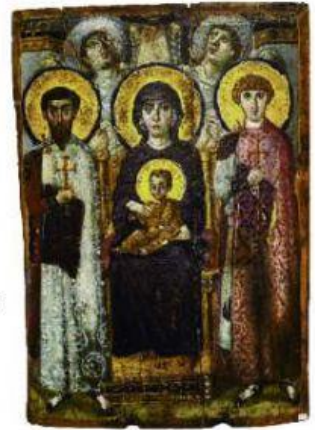
Virgen María en el trono, entre san Teodoro y san Jorge. Icono bizantino. Siglo VI.

Después de la caída de la capital a manos de los turcos en 1453, la tradición iconográfica se mantuvo en zonas ocupadas anteriormente por el Imperio bizantino, como Rusia y Grecia.