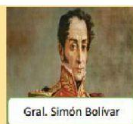
Gral. Simón Bolívar

3. ¿Quién estaba al mando de las tropas realistas?