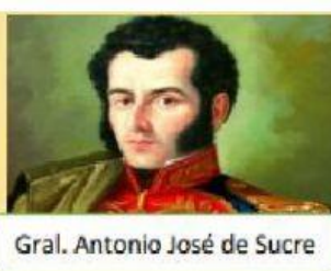
Gral. Antonio José de Sucre