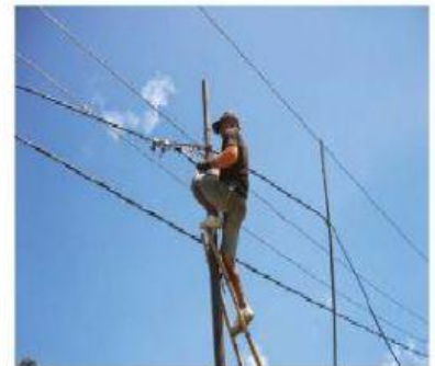
Gambar 8. Pemasangan Kabel Listrik

Pada umumnya benda atau zat padat akan memuai atau mengembang bila di panaskan dan menyusut bila di dinginkan. Mari kita perhatikan pemasangan kabel listrik. Pemasangan kabel listrik dipasang tidak kencang. Hal ini untuk memberi ruang jika tidak terjadi pemuaian pada malam hari kabel listrik akan kencang dan putus.