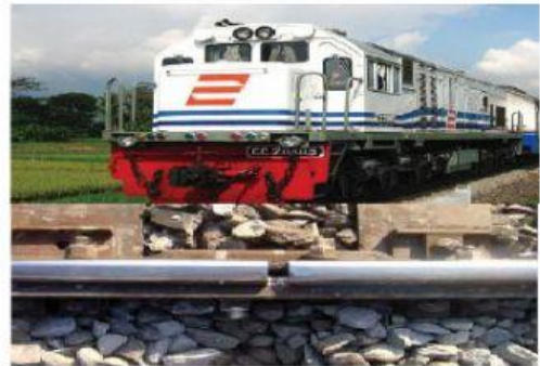
Gambar 7. Rel Kereta Api

Ayo analisa permasalahan berikut. Jika kita melihat kereta api melintas, Kita dapat melihat rel sebagai jalannya dan Rel kereta api terlihat terpasang agak renggang, kenapa?