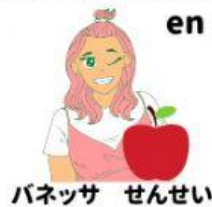
パネッサ せんせい