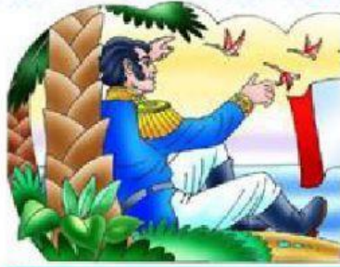
Don José de San Martín