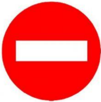
Prohibido el paso

Observa y une las señales de tránsito con la figura geométrica correspondiente.