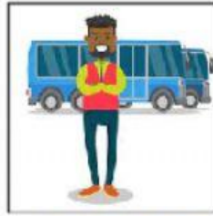
CHOFER DE COLECTIVO