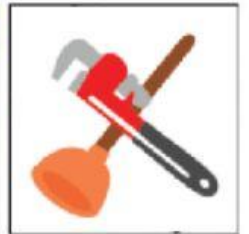
HERRAMIENTAS DE PLOMERÍA