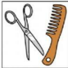
PEINE Y TIJERAS