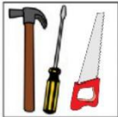
HERRAMIENTAS DE CARPINTERÍA