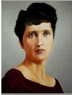
Elvia Carrillo Puerto