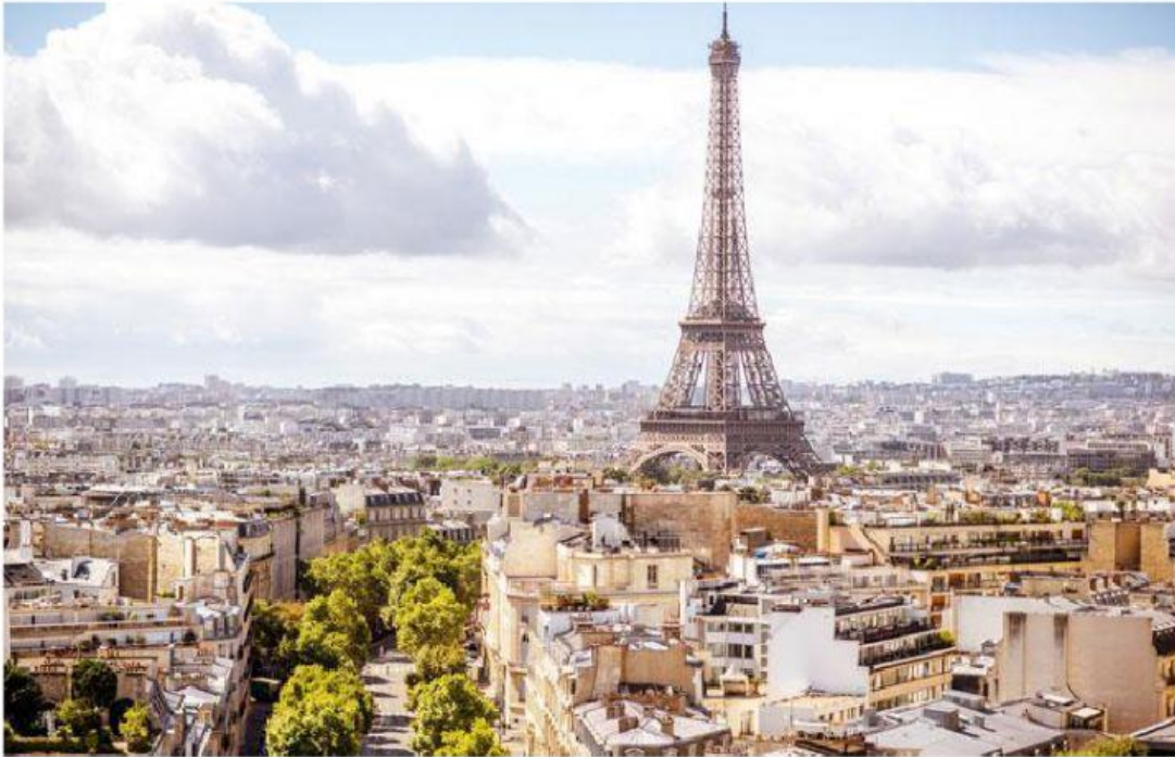
Imagen de París

París es la ciudad más grande de Francia. Se la conoce como la ciudad de la luz. El río Sena divide a París en dos secciones, conocidas como la Rive Droite y la Rive Gauche. La ciudad tiene forma de óvalo. ¿Podéis creer que París empezó como una pequeña aldea de pescadores? El nombre de la ciudad proviene de la tribu gala Parisii, que fue la primera en asentarse en los marjales cercanos al río. En la Edad Media, monarcas poderosos, que reinaron durante más de siete siglos, hicieron que la ciudad floreciera. En los años posteriores al 1800, Napoleón Bonaparte y su sobrino, Napoleón III, se proclamaron a sí mismos emperadores y contribuyeron a engrandecer todavía más la ciudad de París.