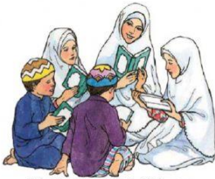
Gambar 1.1 Belajar Mengaji.

وَالنَّازِعَاتِ غُرُقًا (1) وَالشَّامِطَاتِ نَشْطًا (2) وَالسَّابِقَاتِ مَبِيعًا (3) فَالْمُتَبِّرَاتِ أَمْرًا (4) فَالْمُتَبِّرَاتِ أَمْرًا (5)