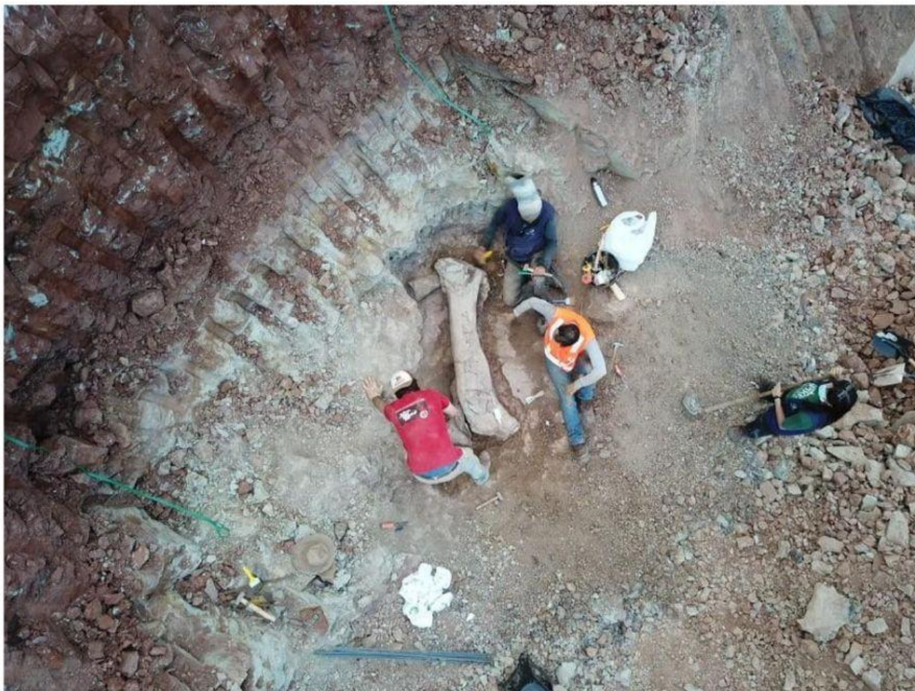
Pedaco de osso de dinossauro encontrado em Davinópolis, no Maranhão