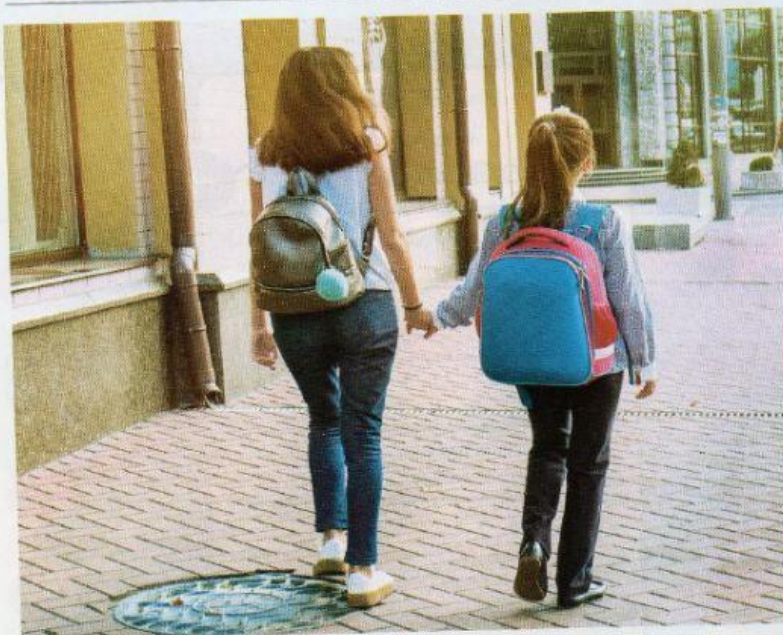
Dos niñas se dirigen al colegio por una de las vías seguras del Colecamins.