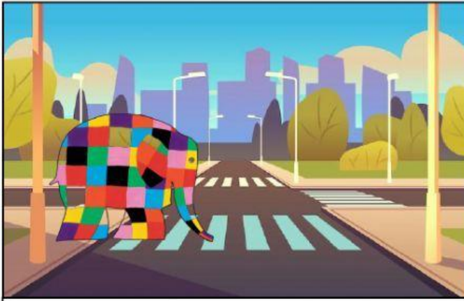
Elmer cruza por el paso de peatones