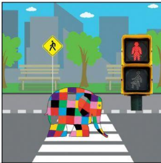
Elmer cruza con el semáforo en ROJO.