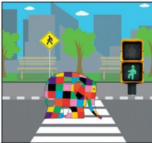
Elmer cruza con el semáforo en VERDE.