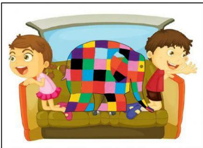
Elmer y sus amigos van en autobús sin cinturón.