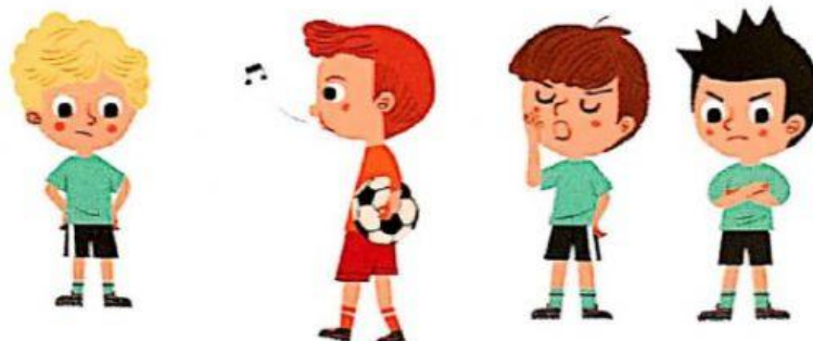
retrasar la reanudación del juego