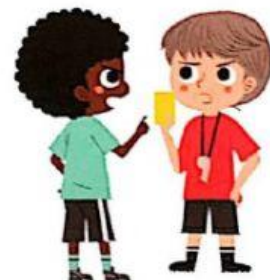
protestar al árbitro