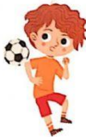
no respetar las reglas del juego