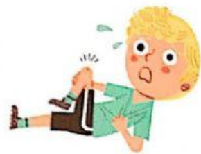
fingir que está lesionado