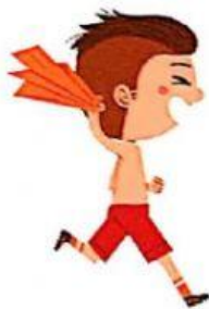
quitarse la camiseta