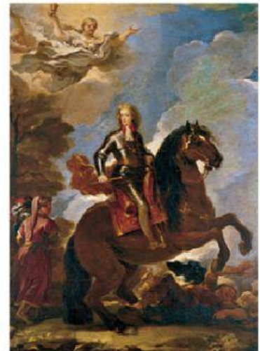
Retrato ecuestre de Carlos II, obra de Luca Giordano.