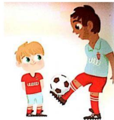
escuchar al entrenador