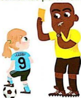
obedecer al árbitro