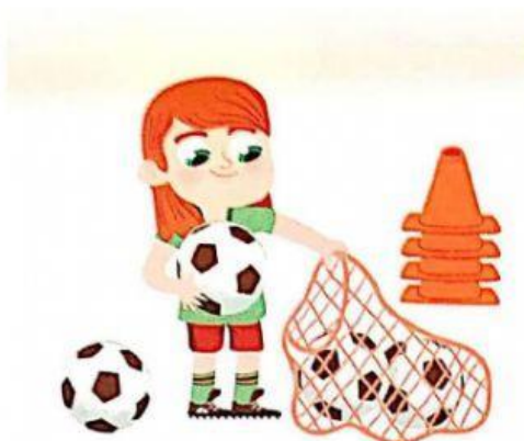
cuidar el material