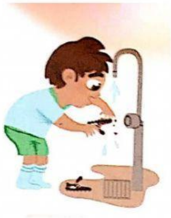
cuidar las pertenencias