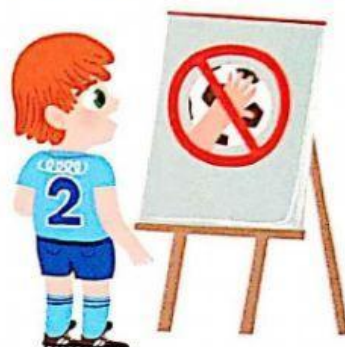
conocer las reglas del juego