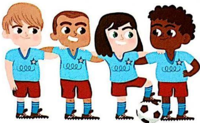
tener espíritu de equipo