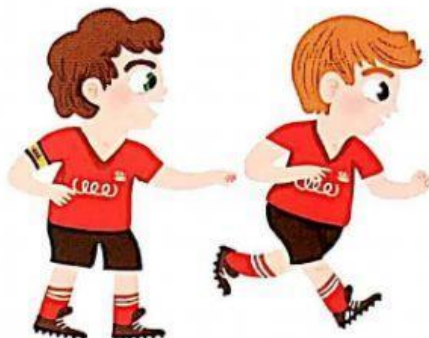
respetar al capitán