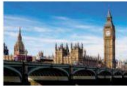
e) Le Big Ben