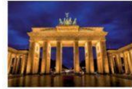
c) La porte de Brandebourg