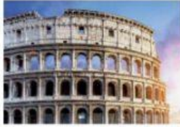
a) Le Colisée