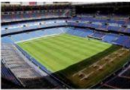
d) Le stade Bernabéu