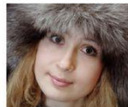
CRISTINA / MOLDAVIA / TIRASPOL