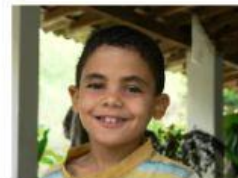
ALONSO / BRASILE / FORTALEZA