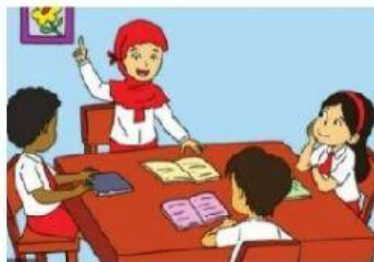
Kerjasama saat mengerjakan tugas kelompok