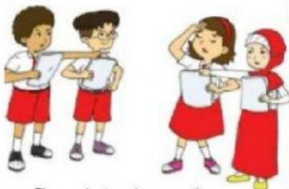
Berdebat saat mengerjakan tugas kelompok