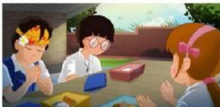
Berdoa bersama dengan teman berbeda agama