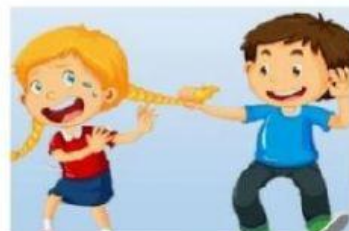
Bertengkar dengan lawan jenis