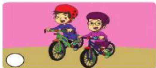
menggunakan perlengkapan untuk keselamatan