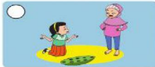
marah karena kalah