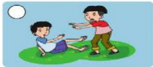
berlaku kasar kepada teman