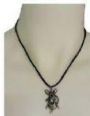
La cadena de un colgante