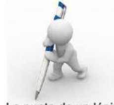
La punta de un lápiz