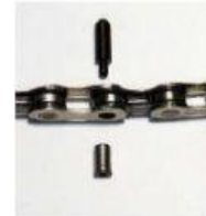
El remache que une dos eslabones de la cadena de una bicicleta