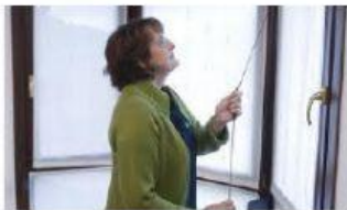
La tira de una persiana