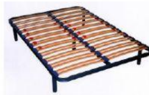
Las tablas de un somier