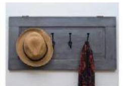
Un gancho colgado en la pared