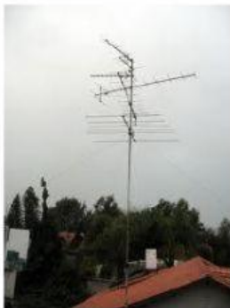
La barra que soporta una antena de televisión