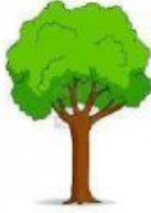
El tronco de un árbol