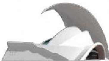
Auditorio de Tenerife