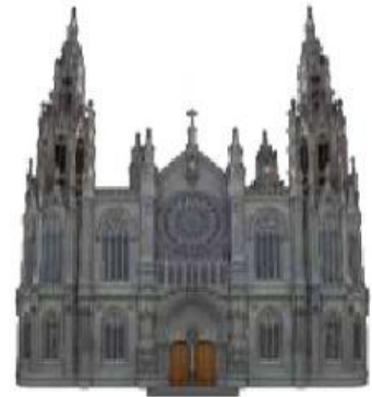
Iglesia de San Juan, Arucas, GC