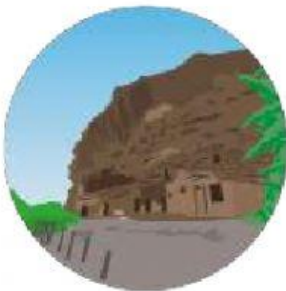
Risco Caído, Gran Canaria