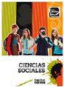
Libro Ciencias sociales

a) Analiza las siguientes imágenes y escribe a qué tipo de fuente histórica pertenece