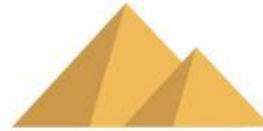
Pirámide de Egipto