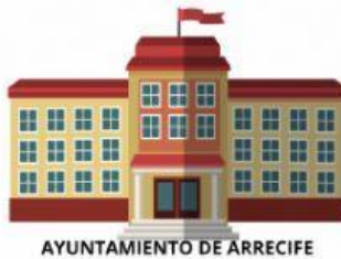
AYUNTAMIENTO DE ARRECIFE