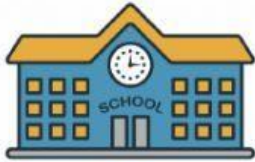
IES AGUSTÍN ESPINOSA

1. Écris le nom de ces endroits avec l'article défini correspondant. 1 POINT