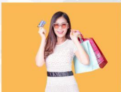
a. fare le spese

1 Osservate queste foto. Quali attività preferite fare il fine settimana?