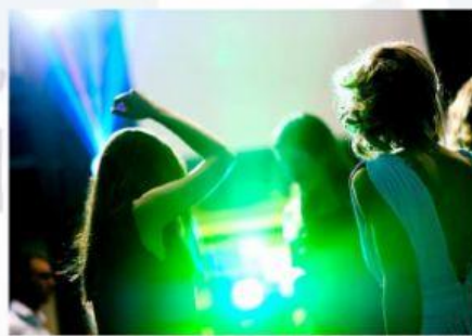
b. andare a ballare