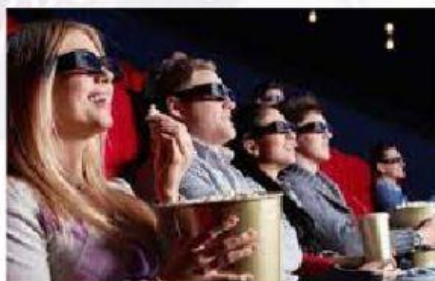
d. andare al cinema