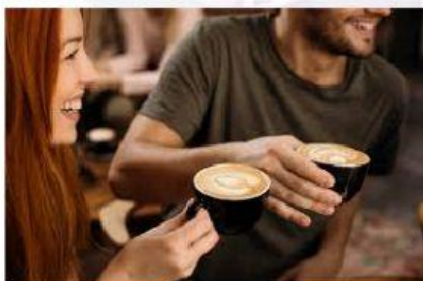
c. prendere un caffè