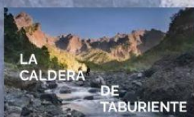
LA CALDERA DE TABURIENTE