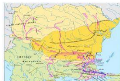
Граници на България при Крум – в тъмножълто до 803 г., в светложълто при Крумовото управление

Освен даровит военачалник, Крум е и талантлив държавник. Той създава първите писани закони еднакви за всички поданици в ханството- българи и славяни. Крумовите закони били насочени към създаване на строги норми в българското общество за защита на частната собственост, предпазване от разоряване на обеднялото население, против клеветниците, лъжесвидетелите, лъжците, крадците и техните съучастници.