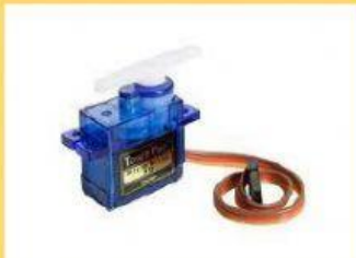
MOTOR PASO A PASO