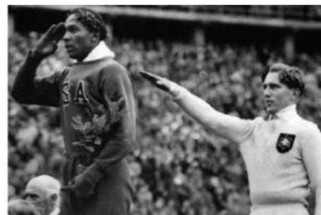
Jesse Owens e Luz Long sul podio