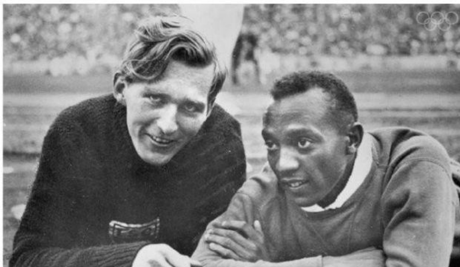
Luz Long e Jesse Owens