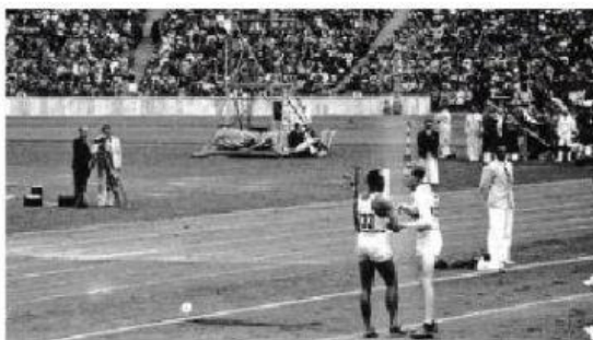
Jesse Owens e Luz Long

Racconterà Owens: "Ci volle molto coraggio per salutarmi davanti a Hitler. Potreste fondere tutte le medaglie e le coppe che ho vinto e non varrebbero l'amicizia a 24 carati che provai per Luz Long in quel momento."