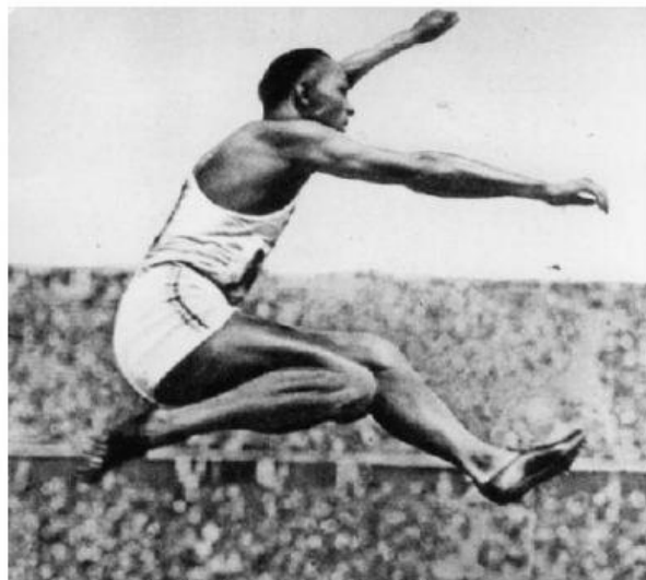
Il salto in lungo di Jesse Owens

Quando Jesse vince la medaglia d'oro nel salto in lungo, Luz è felice per lui, e corre ad abbracciarlo , davanti alla folla e ad Hitler. Luz sa che Jesse può vincere, ma non si interessa di questo e pens ad aiutare l'amico: Luz arriva secondo e vince la medaglia d'argento .