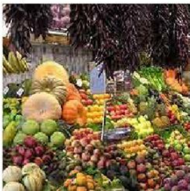
des fruits et légumes