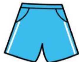
COSTUME DA BAGNO