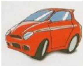
macchina / nuova

3 Osservate i disegni e con l'uso dei possessivi costruite delle frasi come: "La tua penna è blu"