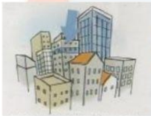
appartamento / in centro