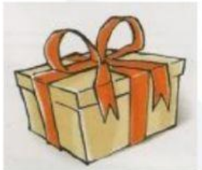
regalo / bello