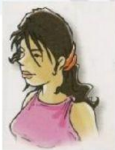
ragazza / italiana